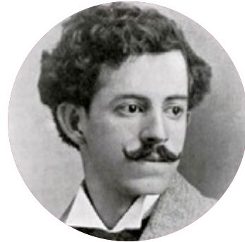
Guillermo Valencia 1873 – 1943

Poeta exponente del modernismo argentino. Se destacó por ser precursor del verso libre en la literatura hispánica además de la literatura fantástica y la ciencia ficción en su país.