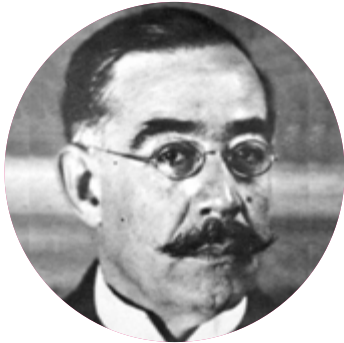
Leopoldo Lugones 1874 – 1938

Poeta exponente del modernismo argentino. Se destacó por ser precursor del verso libre en la literatura hispánica además de la literatura fantástica y la ciencia ficción en su país.