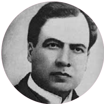
Rubén Darío 1867 – 1916

Poeta pionero del modernismo colombiano, de gran influencia panasiática, del simbolismo francés y finalmente el modernismo el cual fue influenciado por el mismo Rubén Darío. Su único libro publicado de versos fue Ritos.