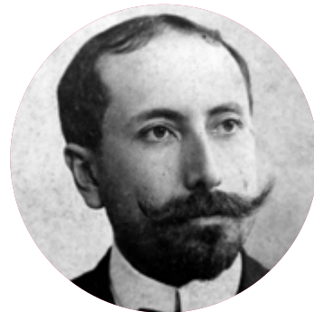
Amado Nervo 1870 – 1979

Poeta, periodista y diplomático nicaragüense. En 1888 estando en Valparaíso, escribe su más grande obra "Azul" considerada la precursora del modernismo.