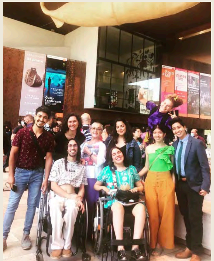
El equipo en la plaza central de GAM.