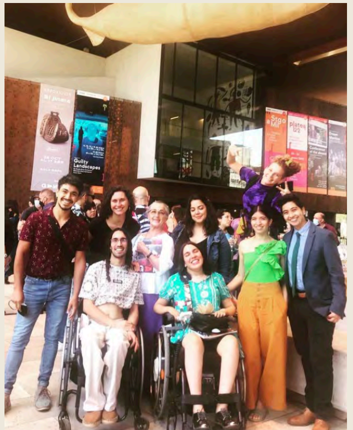
El equipo en la plaza central de GAM.