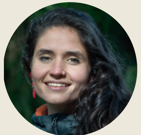
Producción Cecilia König