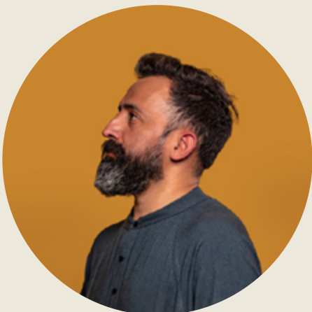
Dirección, sonido, proyecciones Claudio Puebla