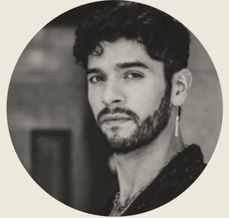
Producción y asistencia de dirección Ignacio Pérez Ulloa