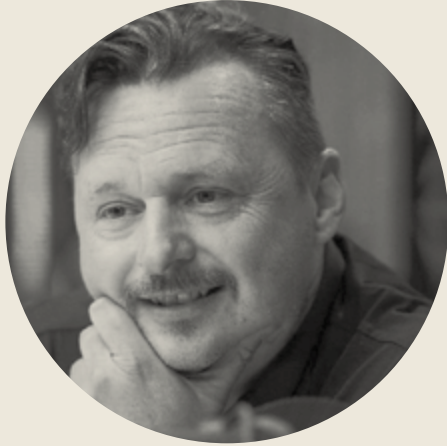
Dramaturgia y dirección Michael De Cock