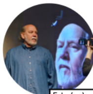
Esto (no) es un testamento

*No se cuenta con el dato de asistentes a 5 funciones que se realizarían después del cierre de esta edición.