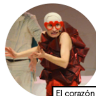
El corazón del gigante egoísta