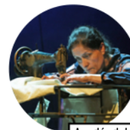
Ayudán drole a sentir