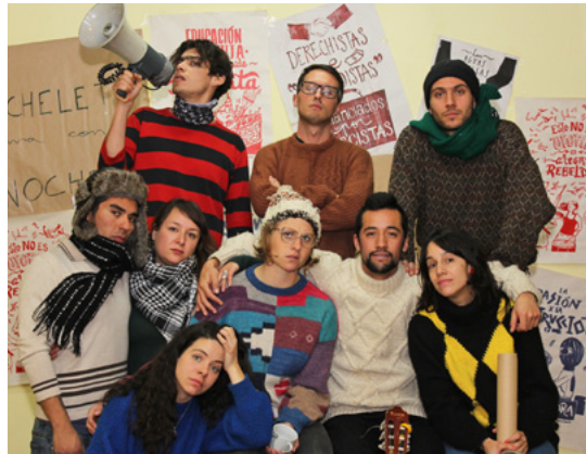
Toma © Josefina Fernández Barros