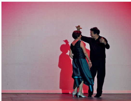
El baile