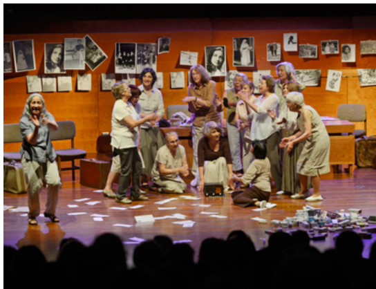
Seré patrimonio

Para celebrar el trabajo sostenido de los talleres de lectura reeditarán en agosto el primero de todos, el Taller de lectura: Literatura y arte , que abrió en marzo del 2012 esta tradición de juntarse a leer y conversar. Así los lunes de agosto, entre 15 y 17 horas, se dedicarán a revisar textos, cuentos, cartas y ensayos como La obra de arte , de Antón Chéjov, y La agonía y el éxtasis , de Irving Stone. La última sesión del taller será una convivencia para celebrar que se pasó agosto. Los adultos mayores interesados en participar pueden inscribirse en el correo martasuarez@gam.cl