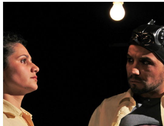
Superhéroes en tu jardín...