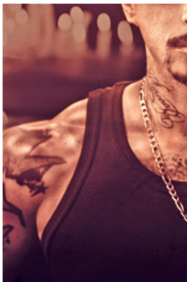
Imagen: © Javiera Eyzaguirre