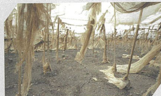
Montserrat Soto. Invernadero XIX , fotografía cromogénica, 125 x 250 cm, 2006