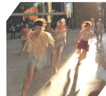
La obra de danza Tramas coreográficas de José Vidal cierra la feria.