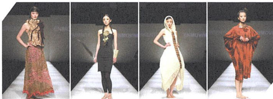
Diseños chilenos en Shanghai Fashion Week 2009